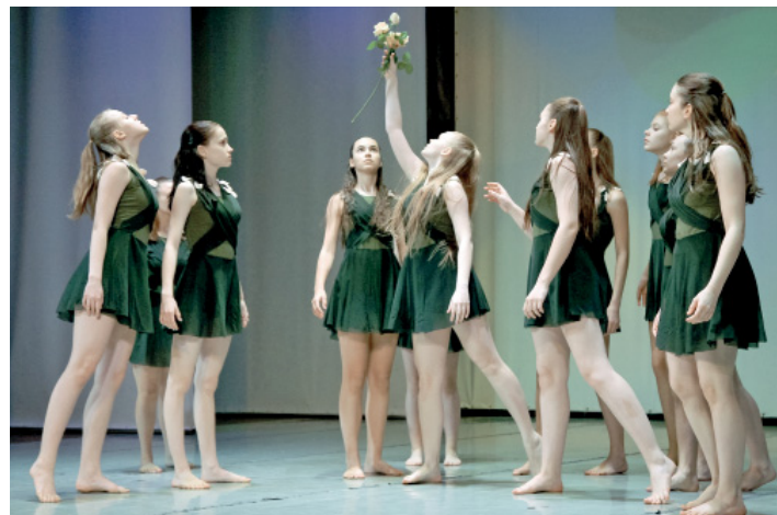
Постановка «Почему вянут розы?», номинация «Современный танец» (13 – 15 лет).

В марте при поддержке Министерства Культуры РФ прошел международный конкурс «Планета талантов». От хореографического коллектива «Полет» участие приняли около 100 учениц в возрасте от 4 до 15 лет. Было представлено девять разнохарактерных постановок в трех номинациях. Все номера были отмечены званиями лауреатов, а в номинации «Современный танец» коллектив был признан лучшим! Выразительное, вдумчивое исполнение тронуло души зрителей и заслужило высокие оценки от авторитетного жюри, наградившего коллектив званием Гран-при!