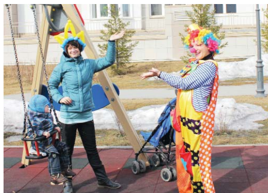
Клоун дарил веселье детям и их родителям!