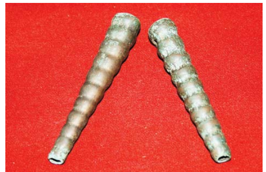
Пронизки – украшения бронзового века.

Среди керамических изделий найдены каменные грузила, литейные формы и бронзовые украшения, в числе которых две гофрированные пронизки конической формы, массивная подвеска и две пронизки на кожаном ремешке. На поселениях, при раскопках, археологи нередко находят литейные формы, тигли, льячки. Здесь же встречаются каменные колотушки для дробления руды.