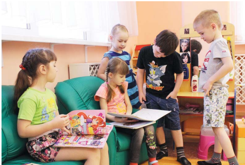
Дружелюбная атмосфера в группе необходима полноценного развития детей.