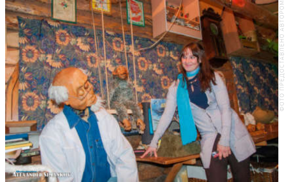
Театр «Два плюс Ку» начал свои представления осенью 1990 года.

Почему из маленьких пушистых липук получаются вредины и занимают все пространство в доме? Что делать, когда становится не о чем говорить? А может, отправиться куда-то и начать все заново? Пожалуйста! Только однажды ночью далекая звезда станет для тебя близкой и позволит посмотреть на огромный мир с высоты, и ты поймешь, что липуки везде бываю сначала маленькими и славными, а потом могут стать врединами! И что же с этим делать? И