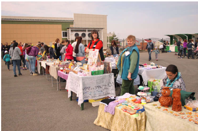
24 апреля на парковке за Мария-РА прошла ярмарка.