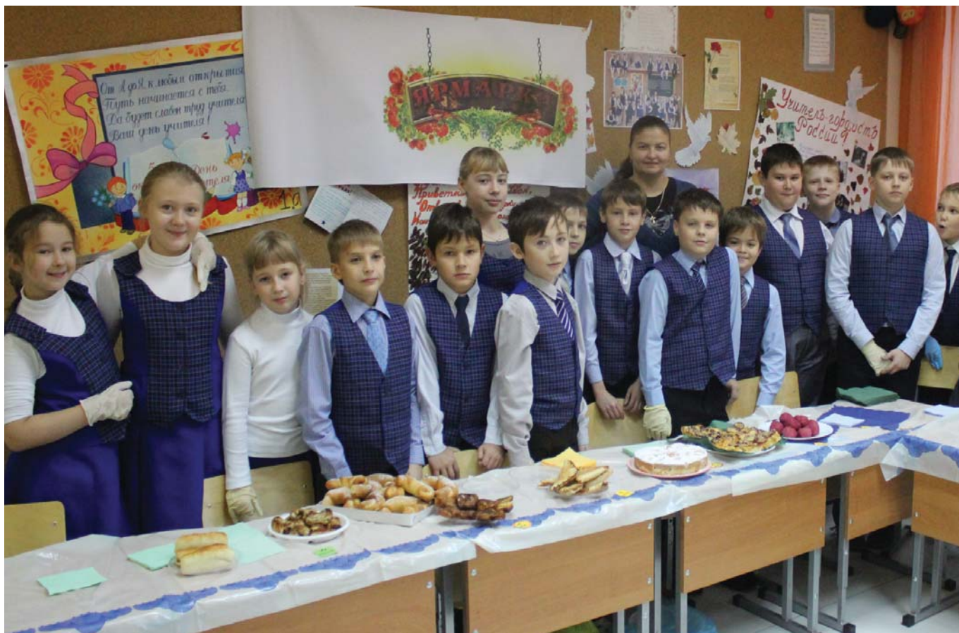
4 «Б» принял активное участие в проведении ежегодной ярмарки.