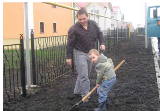
Посадить дерево нужно вместе с сыном

города-спутника, необходимо проводить собрания с будущими жильцами. Сегодня осуществить это довольно труд-