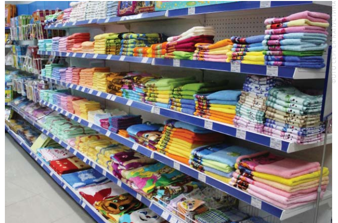
«Новэкс» – магазин для всей семьи.