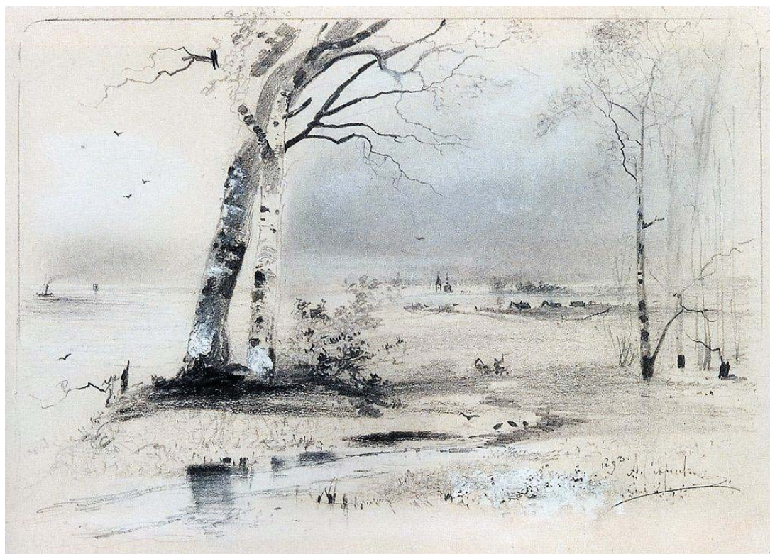
Алексей Саврасов. Ранняя весна. Березы у реки. 1893

Звоните и присылайте работы: тел. 8-961-717-81-39, e-mail – nlp41@yandex.ru