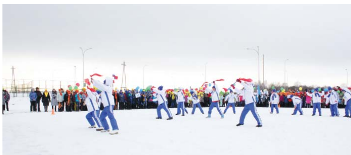
Малые Олимпийские игры в гимназии посвящены грядущим играм в Сочи.