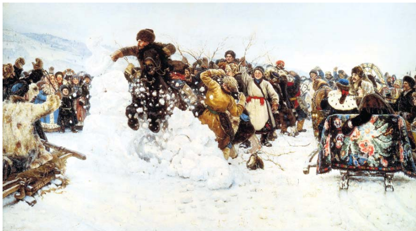
Василий Суриков. Взятие снежного городка.

Кульминацией праздника станет выход Деда Мороза и Снегурочки, которые поздравят жителей района с праздником. Вместо традиционного хоровода вокруг елки будет организована массовая семейная зарядка, посвященная предстоящим Олимпийским играм в Сочи.