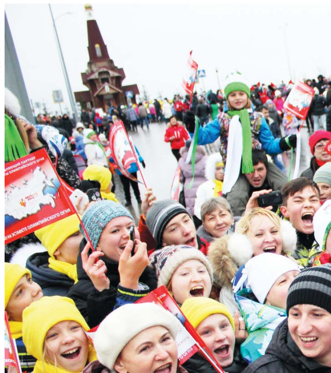
Море улыбок и радостных глаз встречали участников эстафеты. Для зрителей это событие стало настоящим праздником и останется в их сердцах на многие годы.