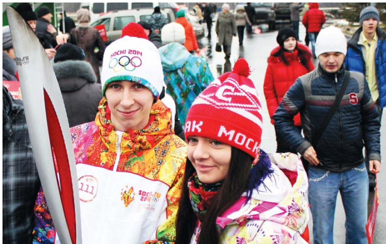
Собери олимпийский набор: флажок, шарик и фото с фанелоносцем на память.