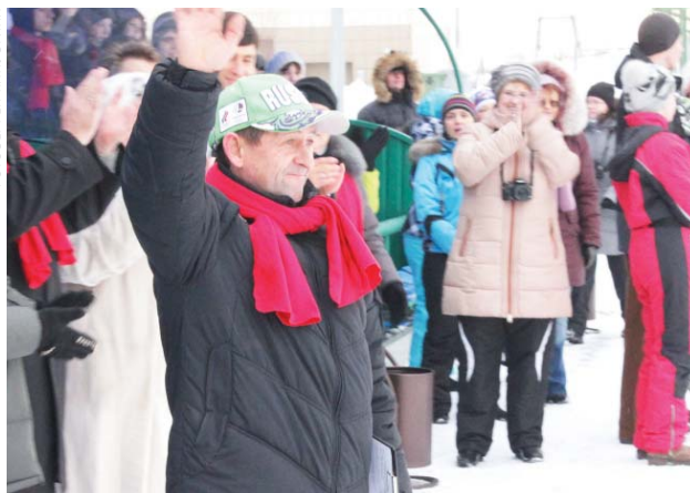
Вячеслав Иваненко, олимпийский чемпион по спортивной ходьбе на 50 км 1988 года, принимал участие в судействе игр в гимназии.