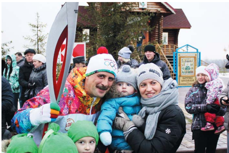
Это фото займет почетное место в семейном архиве.