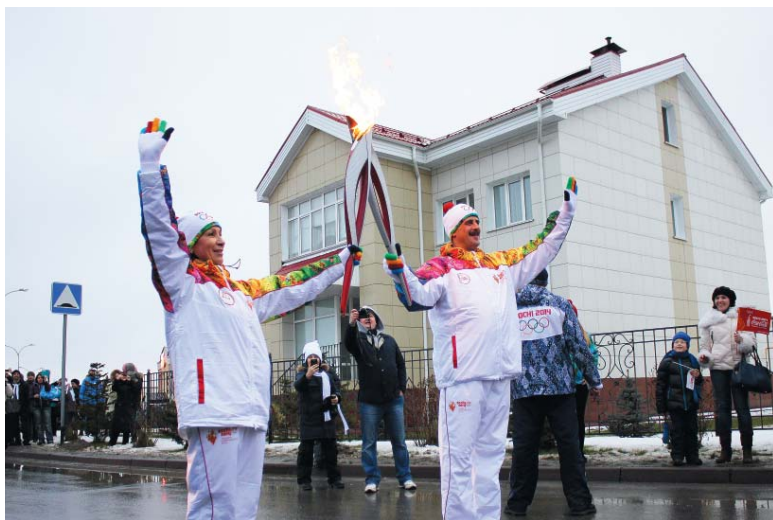
Передача олимпийского огня – целый ритуал.