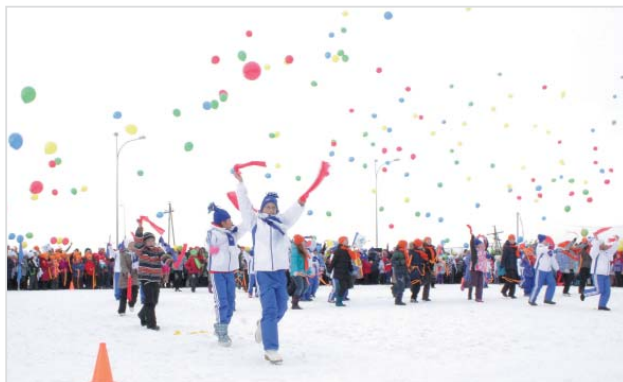
Здоровье на 53% зависит от образа жизни.