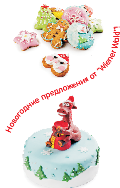
Новогодние предложения от «Viner Wald»!

ники в дружном семейном кругу проходят на ура. Для наших самых маленьких Гостей мы с удовольствием празднично оформим зал, и если необходимо, пригласим веселого аниматора. Безусловно, у нас можно заказать и эксклюзивный праздничный торт, как для детского праздника, так и для любого праздничного события в вашей жизни. Если говорить про особые вкусовые пристрастия, то в Лесной поляне очень любят наш фирменный зефир, кстати, он ручной работы, ромовую бабу и медовые конфеты. А если говорить про торты, то несомненным лидером остается «Штраус» и очень любят торты из домашней коллекции: «Наполеон», «Дамские пальчики» и «Домашний сметанный». Я бы очень рекомендовала попробовать, помимо, уникальный торт «Четыре молока», а любителям классики – «Три шоколада». Совсем недавно мы предложили своим Гостям блинчатые пироги: