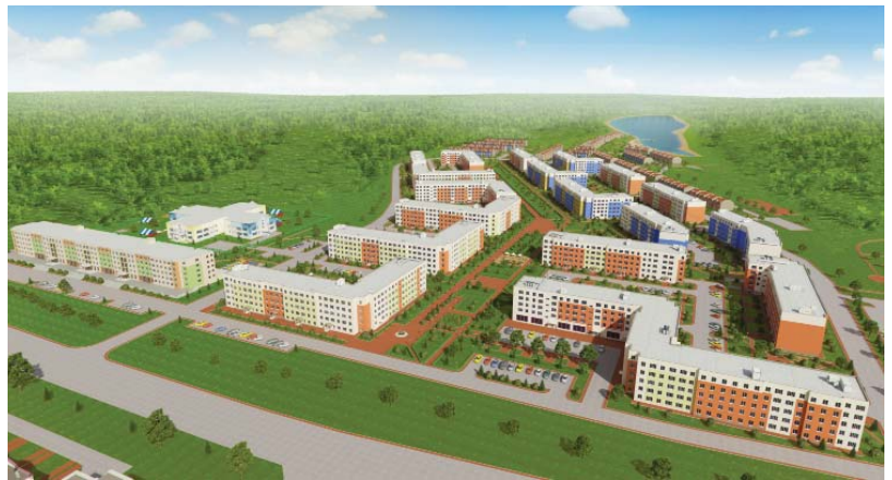
Примерная схема застройки третьего микрорайона Лесной поляны.

Сердцем первого микрорайона по праву считается проект Весенний. Как мы уже писали, его продолжением станет Осенний бульвар в третьем микрорайоне. Прогулочно-парковая территория с детскими игровыми площадками, со скамеечками для отдыха и элементами малых архитектурных форм раскинется на 1,5 км. Ее завершением станет каскад прудов. Уже в следующем году планируется создать первые 240 метров Осеннего бульвара, а в конце него – разбить первое искусственное озеро. Возле озера можно будет не только отдохнуть, присев на скамейку, но и укрепить свое здоровье, заглянув на открытую спортивную площадку. Все это будет создано в рамках концепции рекреационно-туристского направления в Лесной поляне. Напомним, что в прошлом году в рамках данного направления был заложен парк детства за храмом часовней им. св. Матроны