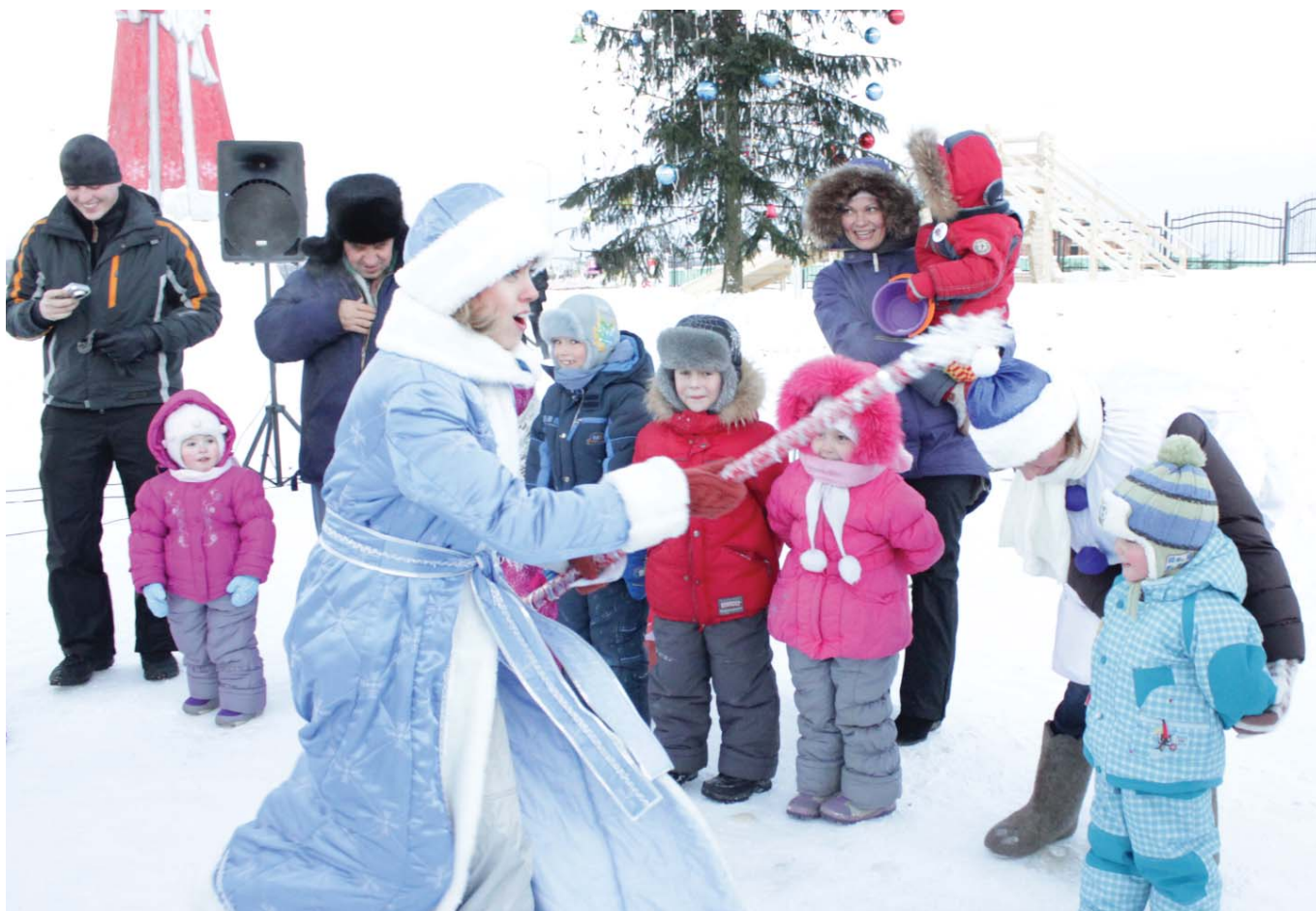
Снегурочка играет с детворой в «Ух, заморозку!»