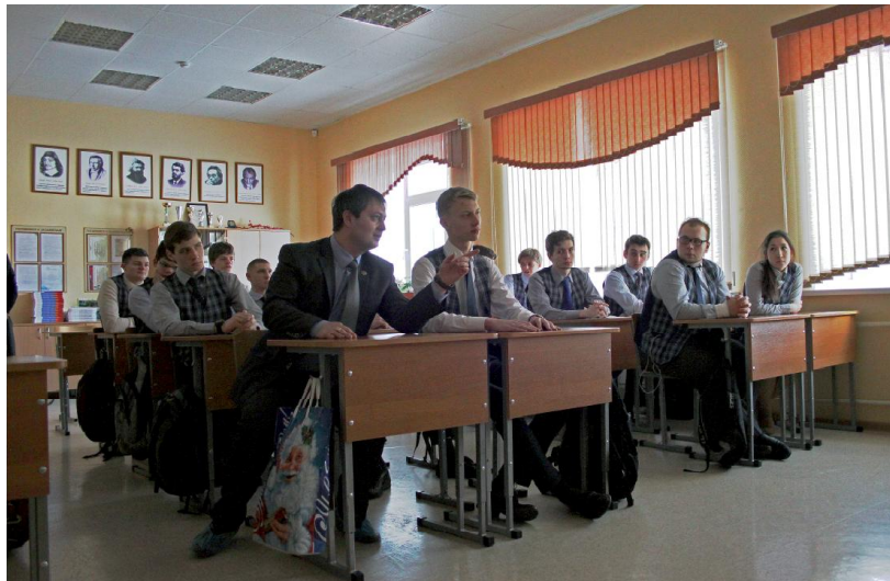
ФОТО ТУ ЖУР ЛЕСНАЯ ПОЛЯНА

«День молодого избирателя» - это новый всероссийский праздник, который отмечается каждое третье воскресенье февраля. В этот день по всей России проводятся мероприятия с участием молодых и будущих избирателей, конкурсы, деловые игры, встречи с депутатами законодательных органов.