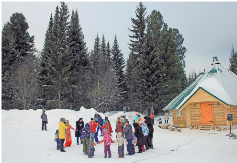
Какая же масленица без хоровода?