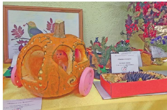
Выставка работ воспитанников детского сада – повод для гордости родителей и воспитателей.