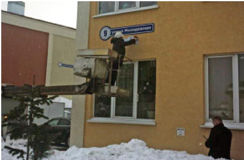
@andrey_chibis. Вешаю первую в России табличку «Дом образцового содержания».

В рамках рабочего визита в Кемеровскую область 17 февраля заместитель Министра строительства и жилищно-коммунального хозяйства Российской Федерации, Главный государственный жилищный инспектор Андрей Чибис впервые установил на дом по адресу Молодежная, 9 «Знак качества ЖКХ» - табличку с надписью «Дом образцового содержания».