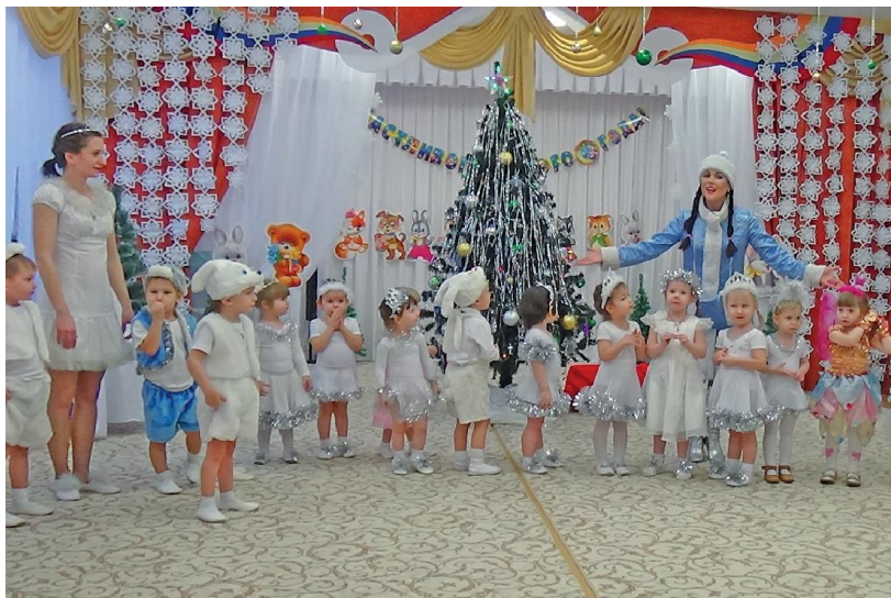
В этом году на «Солнечной полянке» впервые встретили Новый год.

14 февраля МАДОУ № 26 «Центр развития ребенка – детский сад» исполнилось полгода. За этот небольшой период под руководством молодого, но дружного и творческого коллектива педагогов в детском саду прошло множество интересных мероприятий и праздников.