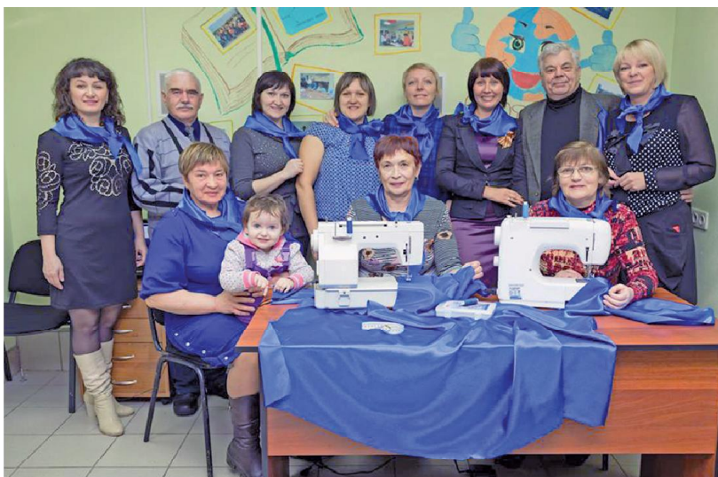
Силами лесополянцев будет изготовлено около 1000 синих платочков.