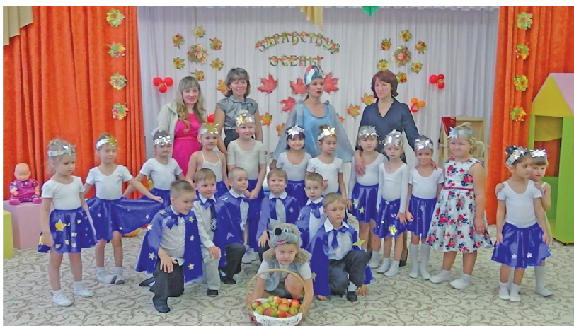
Золотая осень – отличный повод для праздника!